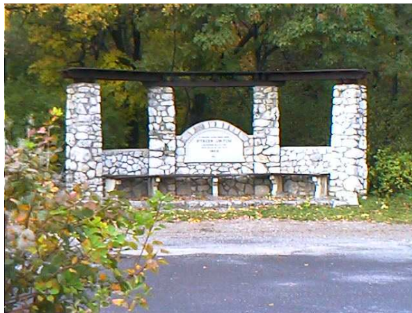
Ptaček pihenő a Dömörkapunál

A Mecsek Egyesület lelkes tagja, halála után emelték emlékére a Dömörkapunál található Ptaček pihenőt.