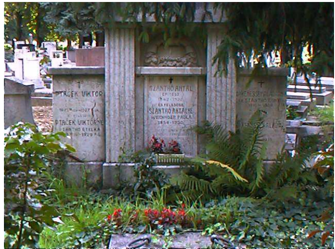
A Szánthó-sírbolt a Pécsi Köztemetőben, Ptaček Viktor és felesége nyughelye