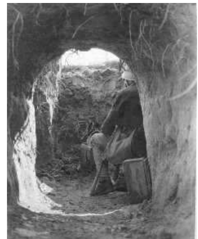
"Tiszti kaszinó" a lövészárokban ----- Állás a Piave mentén