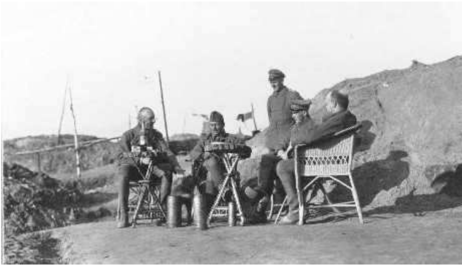
Borosüveg és gránáthüvely...