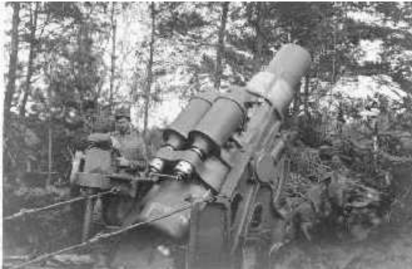
A híres 30,5 cm-es mozsár