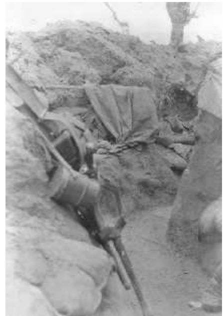
Lövészárok csata után